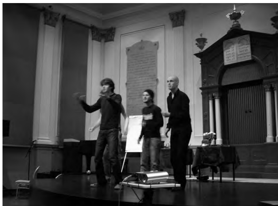
Herman in een bakje geitenkwark

miste doelstellingen als zeer stressvol werd ervaren, en dat daardoor de drempel voor de student steeds hoger komt te liggen. Kernvraag scheen óf en hóe je concentratie kunt dwingen, in de hoop afleidingen te kunnen beperken, en hoe je jezelf het beste kunt aansturen als aankomend artiest en uitvoerend musicus.