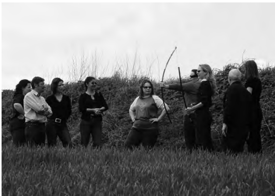
foto: een oefening voor de adem-stemkoppeling van Coblenzer: Das Bogenspannen

overs, geef ik stemtherapie en logopedie. Voor mij zelf geven de groepstrainingen voor bedrijven en particulieren de meeste voldoening.