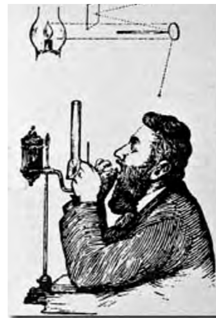
Manuel Garcia inventor of the laryngoscope

Manuel Garcia (1805-1906) schrijft een zeer belangrijk zangpedagogisch boek waarin hij het onder andere over registers heeft. Hij spreekt van borststem, kopstem en falset. Bij vrouwen noemt hij het middenregister 'falset'. Daarnaast gebruikt hij termen als 'timbre sombre' en 'timbre clair'. Tijdens de ademhaling is het belangrijk om de borst vooruit te houden en de buik naar binnen