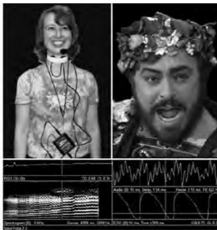
cover Resonance in Singing

Een belangrijk deel van de informatie is te vinden op de CD-ROM waarmee je ook VoceVistaPro kunt installeren op je computer. Dit programma is ook nodig als je metingen